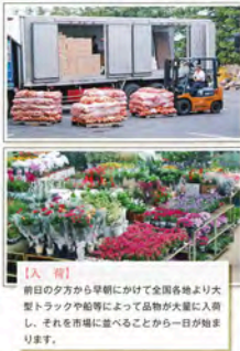
【入荷】 前日の夕方から早朝にかけて全国各地より大型トラックや船等によって品物が大量に入荷し、それを市場に運ぶことから一日が始まります。