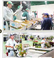
【せり】午前7時(仮定) 午前10時(仮定)～午後1時(仮定) 午前10時30分(仮定)～午後1時(仮定) 卸売業者と買い手(仲卸業者、売買参加者)の間でせりが始まります。申込価格の最高値が決定価格となり卸売価格が決まります。価格の決定には、この時に相対売りがあります。