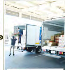
【搬出】 売買参加者や買出人が仕入れた品物はそれぞれスーパーなどに運ばれて陳列され、消費者の皆さんに販売されます。