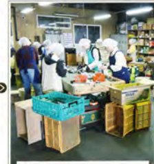
【分装】 市場内の仲卸売場で品物が小口に仕分けされ、売買参加者や買出人に販売されます。