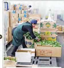
【開場・下足】午前5時30分開始 卸売場に配列された品物を「せり」に先立って、品定めをします。